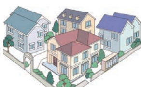
集団供給のお客様