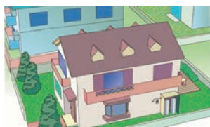
個別供給のお客様

※質量販売、国および地方公共団体、工業・農業用など高圧ガス保安法上の消費者は対象外となります。