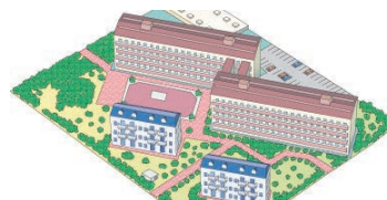
コミュニティーガス団地のお客様